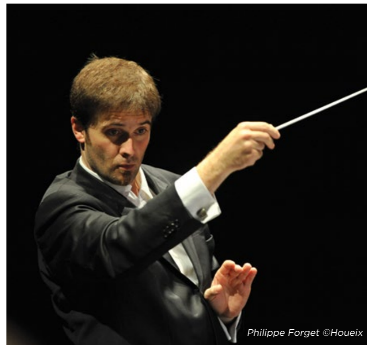
Philippe Forget

Ως συνθέτης και αρχιμουσικός, ο Philippe Forget δημιούργησε την «Awatsihu», μία παιδική όπερα με τη χορωδία Solistes de Lyon/Bernard Tétu. Συνέθεσε και τη μουσική και το λιμπρέτο και βραβεύτηκε από το Ίδρυμα Beaumarchais. Το 2011 διύθυνε το Μπαλέτο της Εθνικής Όπερας του Μπορντώ στον Μεσσία του Χέντελ, σε χορογραφία του Mauricio Wainrot. Το 2012 η όπερα-δωματίου του Μάκβεθ, παρουσιάστηκε από την Compagnie de l'Opéra Théâtre και τους σολίστ της Εθνικής Ορχήστρας της Λυών.